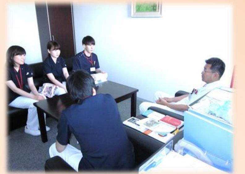
お土産を持って三島院長に報告です