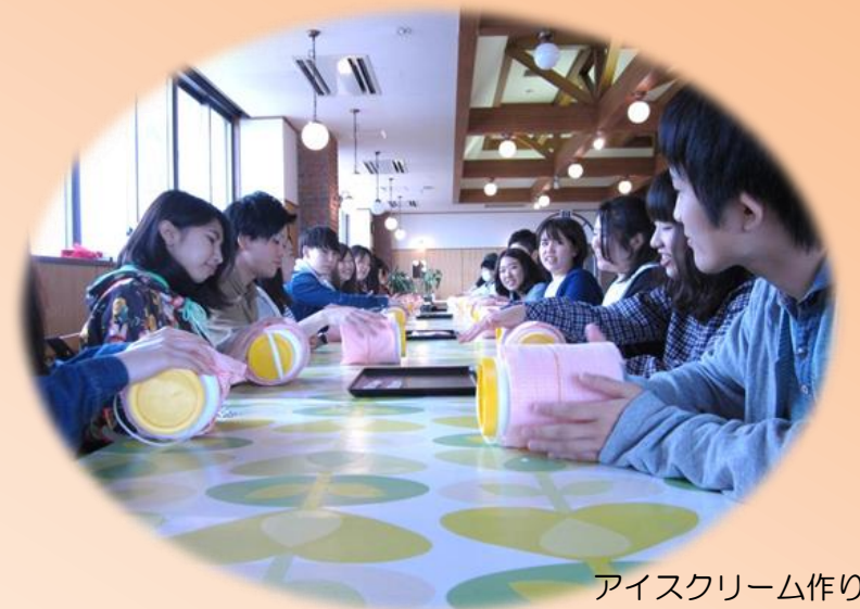
アイスクリーム作り