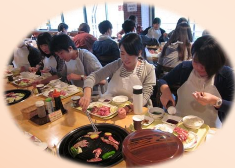
大笹牧場名物 ジンギスカン

今年度4月1日入職者（新卒者）対象のリフレッシュ研修を、5月27日（土）に行いました。 看護部5名、リハビリテーション科7名、臨床検査技術科、薬剤科、臨床工学科、放射線技術科、通所リハビリテーション科から各1名ずつの総勢17名の参加がありました。 リフレッシュ研修は、職場を離れて心と体をリフレッシュすること、職種を超えた仲間同士の交流で絆を深めることを目的としています。 日光霧降高原でのハイキング、アイスクリーム作り体験などを行い、1日有意義に過ごすことができました。