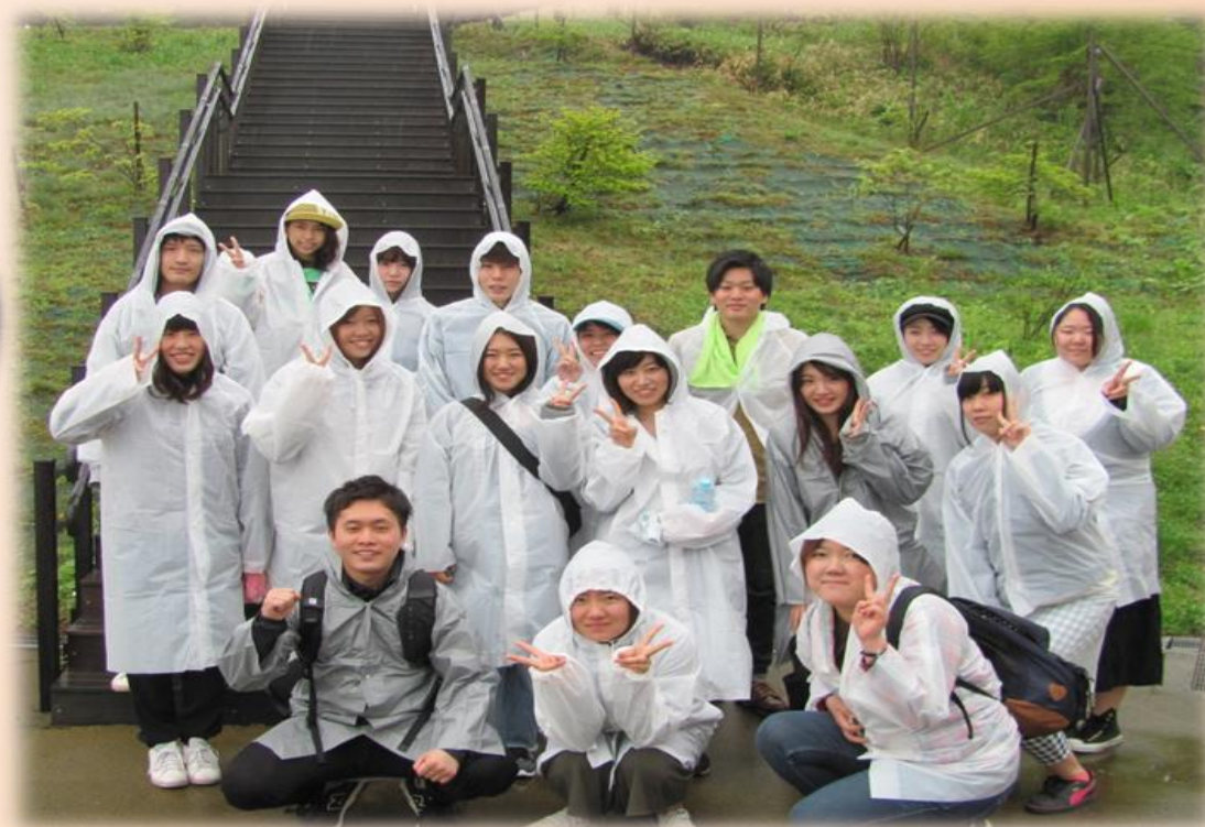
雨の中頑張って歩きました・・・